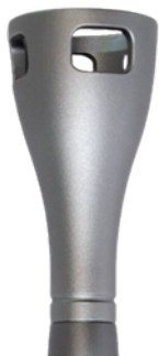
TERAPIA EXTRA ORAL