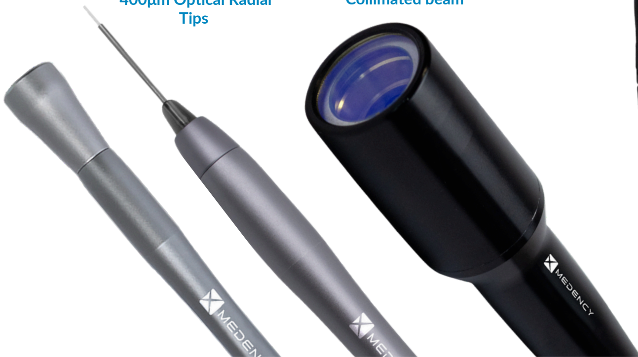
DIRECTO Collimated beam Tips