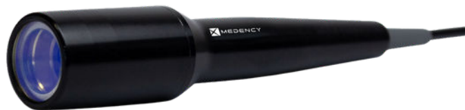
DIRECTO Collimated beam